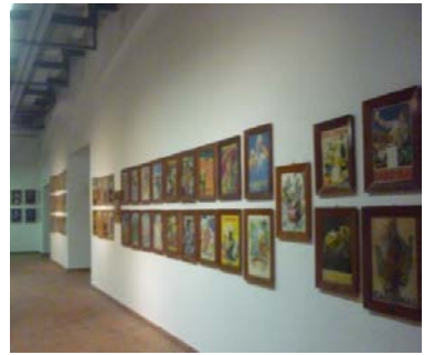
La Galerie des affiches CARDINAL