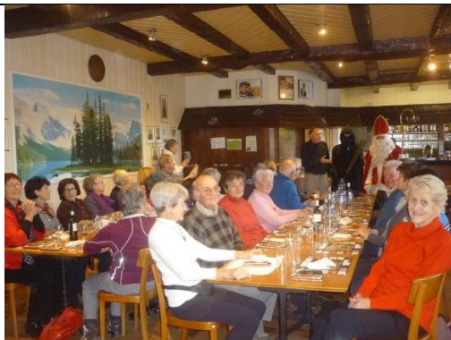
Saint Nicolas accompagné du Père fouettard s'adresse aux randonneuses et randonneurs du MDA.

Inscrire la « Saint-Nicolas » dans le programme des randonnées du MDA fut une excellente idée. Près de trente marcheurs étaient en effet présents à la buvette du Stand des Faveyres, à Marly, le 6 décembre. Saint Nicolas les a accueillis avec joie, et a distribué force biscômes et bons mots.