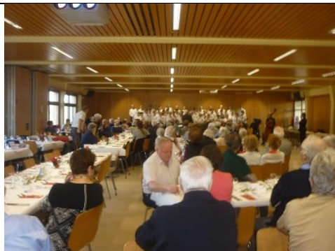
Les participantes et participants à l'heure du concert.

Le repas annuel du MDA s'est déroulé le 14 décembre 2016 au Rest. de l'Escale, à Givisiez. Il a suivi le Concert donné par la Chorale et l'Orchestre de Chambre du MDA. De bons moments dans un ambiance décontractée et musicale.